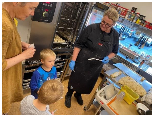
Kosning um þema

Á fyrsta fundi umhverfisnefndar voru þemu vetrarins 2023 – 2024 valin og ákveðið að allur leikskólinn ynni saman að þessum þemum. Sammælt var um að gefa öllu starfsfólki leikskólans og öllum börnum á tveimur eldri deildum leikskólans kost á að kjósa á milli tveggja þema á hvorri önn. Á haustönn var kosið á milli matarsóunar og hreyfingar og varð matarsóun fyrir valinu. Á vorönn var kosið á milli útiveru og jóga – núvitund og varð jóga – núvitund fyrir valinu. Við mat á stöðu mála var gátlisti fyrir neyslu og úrgang fyrir leikskóla fylltur út. Fyrir lýðheilsu var gátlisti fyrir leikskóla og yngsta stig fylltur út. Gátlistarnir voru fylltir út eftir kosningu á þema og áður en þemavinna hófst. Tveir elstu árgangarnir á tveimur elstu deildunum sáu um að fylla út gátlistana með kennurum. Niðurstöðunum var deilt með tveimur yngri deildunum, stjórnendum og eldhúsi. Með því að fylla út gátlista fæst góð yfirsýn yfir grænfánastarf skólans en heilt yfir komu gátlistarnir vel út, broskallar við flest allar spurningarnar. Segja má að þemun sem valin voru hafi hafi verið góð viðbót við starf leikskólans tengt heilsustefnunni og grænfánastarfinu.